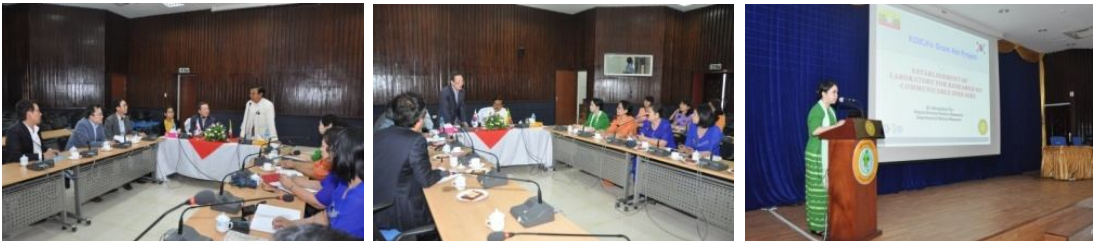
“ aq ;o kw o eOppDxne Oek r fr ဆာESh ji dJpmOek r fr ဆာ w G b n”