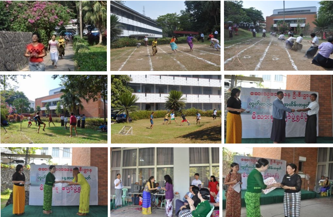
“ အချစ်အားဖြင့် အားကစား ပြိုင်ပွဲများကို အားပေးစွာ ကျင်းပခဲ့ကြပါသည်။ ”